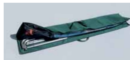
Torba transportowa (112x200cm)

Ponieważ cały czas pracujemy nad udoskonalaniem naszych produktów zastrzegamy sobie możliwość dokonywania zmian technicznych.