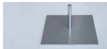
Stopa płytowa ( 30x30cm; 3,9kg)