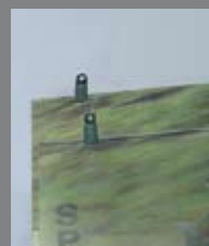
Wklejone w materiał metalowe druty z kompletem klipsów