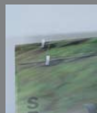
Wklejone w materiał metalowe druty z kompletem wsuwek plastikowych