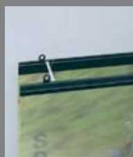
Plastikowe listwy zatrzaskowe kolory: biały, czarny,srebrny, złoty i transparenty